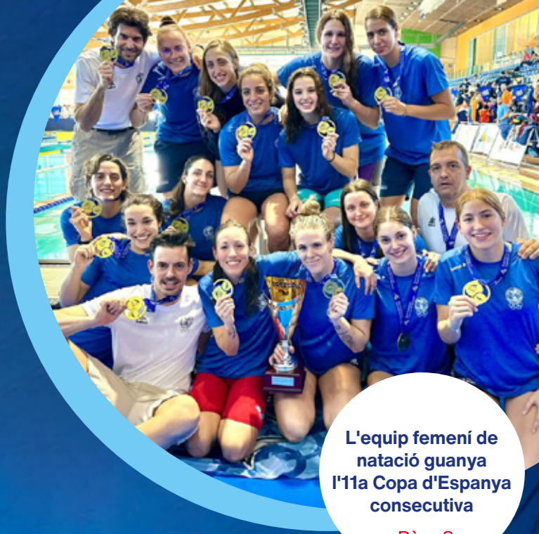
L'equip femení de natació guanya l'11a Copa d'Espanya consecutiva